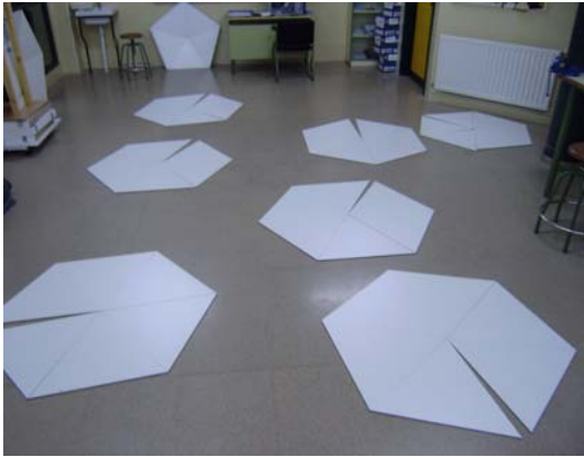
Foto 1: colocación de triángulos para formar los pentágonos y hexágonos

Detallar más cómo se construyó el planetario nos llevaría mucho espacio por eso las imágenes comentarán por sí solas la parte más espectacular del proyecto: la construcción de la cúpula.